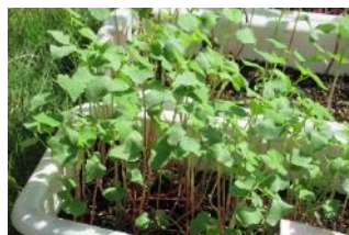
3年生 そばが芽を出しました

いつも地域の皆様には、子どもたちが大変お世話になっております。自治会の方では、通学路や歩道の草刈りをしていただきました。見通しが、大変よくなり安全確認が十分にできるようになりました。夏休みに、農作業体験実行委員会の方には、5年生のしめ縄づくりに使う青田刈りをしていただきました。また、運動場に埋設されていた釘やフックの除去作業を行ってくださった方もみえました。子どもたちの楽しい学習活動や安全な暮らしのために、ご協力いただき、ありがとうございました。